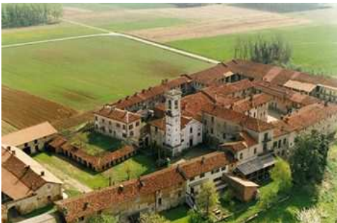
Bellinzago Novarese La Badia di Dulzago

Dalla SP11, in corrispondenza del ponte sul naviglio Sforzesco, si risale il corso d'acqua, nel Parco Naturale Valle del Ticino, per dirigersi, a sinistra, verso Torre Mandelli (tenuta agricola documentata già nel XVI secolo) e voltare a nord per il Boscaccio, il Molino di Vulpiate, le Sette Fontane e villa Fortuna (XVI secolo). Lungo l'alzaia del canale Cavour si raggiunge Galliate (m 153; castello Sforzesco del XV secolo).