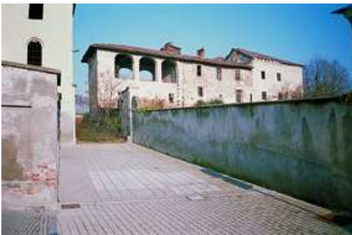
Granozzo con Monticello, Villa Malinverni

Dall'abbazia di San Nazzaro (m 153) si segue la strada sterrata per la cascina Ronchi, deviando poi a sinistra per il santuario della Madonna della Fontana (XVIII secolo) e quindi a destra sulla SP16. Si lascia la strada asfaltata dirigendosi alla cascina Roatella e, tenendo la destra, per Casalvolone (chiesa di San Pietro al Cimitero dei secoli XII-XV). Usciti dal paese in direzione di Pisenngo, si prende a destra la sterrata per la cascina Grancia e Orfengo (m 135).