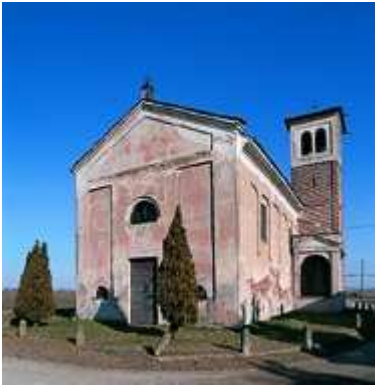
Vespolate Pieve romanica San Giovanni Battista