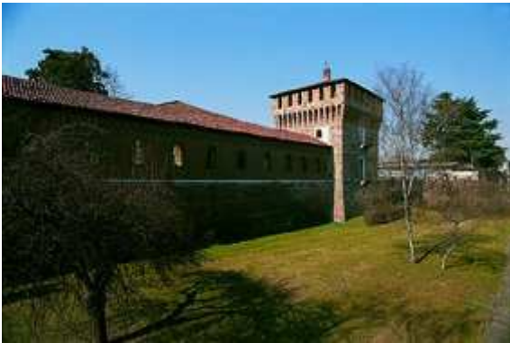
Galliate Castello Sforzesco

presso la località San Martino (m 133) di Trecate (Chiesa Parrocchiale XIX secolo, Chiesa e Convento San Francesco XVI – XVII secolo, Villa Cicogna XVIII secolo).