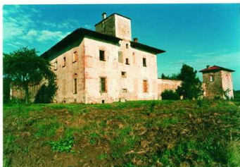
Ghemme Castello Cavenago

Romagnano (abbazia di San Silano del IX-X secolo, villa Caccia del XIX), l'autostrada A26, la cascina Cavenago (XVII secolo), sulla dorsale morenica che sovrasta Ghemme (m 241; ricetta medievale).