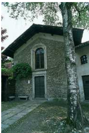
Comignago Abbazia di Santo Spirito

Questo primo percorso collinare lascia Dulzago (m 202) scendendo al ponte sul Terdoppio della SP102. Dalla strada asfaltata si volta a nord, tra i campi, verso Alzate e la cascina Colombarone. Si passa di nuovo il Terdoppio, quindi il rio Rito, per superare la SP17 ed entrare nella baraggia alla destra del torrente Agamo. Si raggiunge quindi la Madonna delle Vigne (m 286), sulla SP18, da cui Mezzomerico dista poche centinaia di metri.