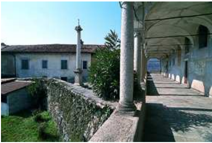
Soriso Ingresso Chiesa parrocchiale

si scende a Gozzano incrociando la SP33. All'altezza di San Lorenzo (chiesa originaria dell'XI-XII secolo) si piega a ovest, nell'abitato, verso Auzate e Soriso (m 452; chiesa barocca di San Giacomo).