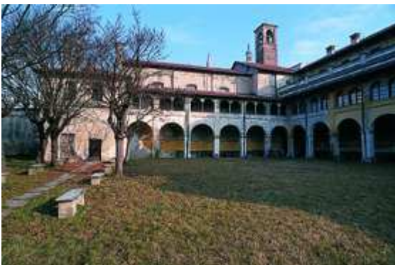
Trecate Convento Chiesa di San Francesco

Si esce da Terdobbiate (m 128) percorrendo il viale d'ingresso al castello e la strada bianca che porta alla cascina Vallini e poi alla SP6. Oltre il Terdoppio, da Sozzago si devia a destra per Villanova, girando a sinistra, in vista della cascina Mirabella, verso la cascina Camerona (documentata nel XVI secolo). Passata la roggia Moretta, la strada asfaltata raggiunge Cerano (m 127; chiese della Natività di Maria del XV secolo e di San Pietro al Cimitero del XIII, molini sulla roggia Cerana).