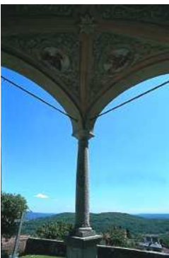
Colazza Chiesa Parrocchiale dell'Immacolata (panorama ingresso)

Da Comignago (m 268), attraversando il Parco Naturale dei Lagoni di Mercurago (zona di stagni e torbiere e di importanti ritrovamenti archeologici), si arriva a Oleggio Castello (chiesa di San Martino del XVII secolo, villa neogotica Dal Pozzo d'Annone). Oltre il torrente Vevera, lungo la SP159 si raggiunge la località Sant'Eufemia, da cui si sale a Paruzzaro (m 334; chiese di San Siro e di San Marcello, originarie dell'XI secolo).