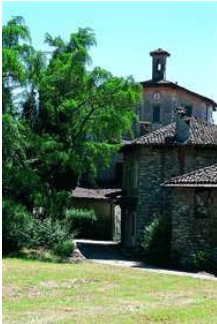
Nebbiuno La Campiglia

dell'Immacolata XVII secolo). Lungo il sentiero F1 (eventuale deviazione per il Sas Priateca, masso erratico a m 677, in 20 minuti) ci si dirige a Fosseno, da cui i segnavia F4, F6, F5 conducono al Sasso del Pizzo (m 763), parete attrezzata dal CAI come palestra di roccia.