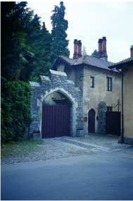
Oleggio Castello Ingresso Villa Dal Pozzo

alla destra il Parco Faunistico La Torbiera. Dal masso erratico detto Prea Güzza si continua per la Riserva Naturale del Bosco Solivo (vista panoramica) e, oltre l'autostrada, Comignago (m 268; abbazia di Santo Spirito, con torre del 1282).