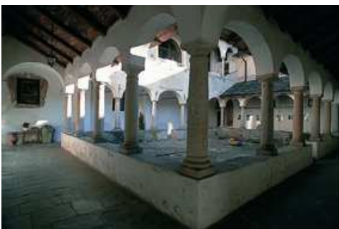
Ameno Convento di Monte Mesma

Da Fosseno (m 600) di Nebbiuno ( i segnavia F6 e F7 portano al giogo del Cornaggia (m 823; eventuale escursione alla cima panoramica del monte Cornaggia, m 921, in 45 minuti), da cui si scende per comodo percorso seguendo il segnavia V. Attraverso gli alpeggi Boccioli (abbandonato) e del Bosco (m 741, ancora utilizzato) si raggiunge la Cappella del Vago, all'incrocio di diversi sentieri. Si continua sempre sul tracciato con segnavia V fino a Cassano (m 659).