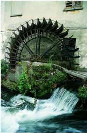
Cerano Molino di San Rocco sulla Roggia Cerana