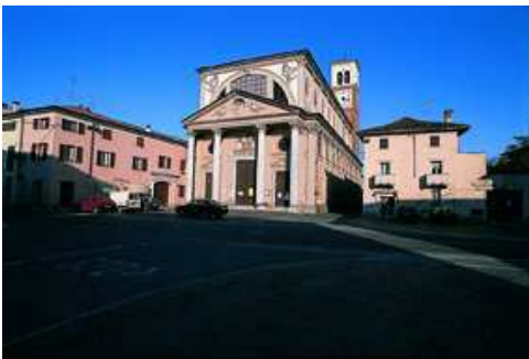
Borgolavezzaro Chiesa SS. Bartolomeo e

Si esce da Granozzo (m 129) lungo il percorso 6 (Graziosa) delle Vie Verdi del riso, in direzione della cascina Martelletto. A Monticello (vestigia del castello medievale) si continua sulla SP6, che passa l'Agogna, e quindi s'imbocca a destra il percorso 2 (Baraggiolo): poco oltre la cascina Brignona si volta a destra sul percorso 3 (Montarsello), lungo la SP97, verso Vespolate (m 123; castello medievale, pieve romanica di San Giovanni Battista).