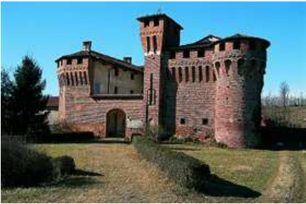
La Rocca di Proh