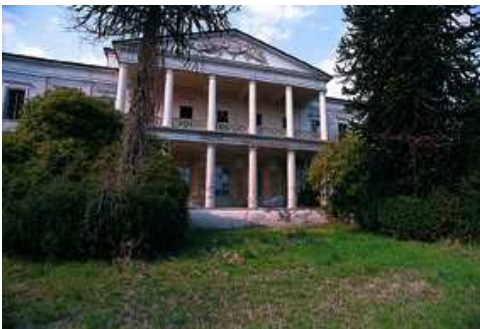
Romagnano Sesia Villa Caccia

Da Soriso (m 452) ( Chiesa parrocchiale di S. Giacomo XVII secolo, Palazzo Ravizza XVII secolo, Villa Mongini XIX secolo) si va alla Madonna della Gelata (chiesa del XVII secolo) e s'imbocca il sentiero con segnavia 791, che presto si lascia per il 793, quindi il 792 e, a sinistra, il 790. Al monte Ciotino si entra nel Parco Naturale del Monte Fenera, deviando a sinistra sul sentiero 798, che si segue fino a San Bernardo (m 775), incrocio di cinque sentieri: preso a sinistra il 777 e poi il 778 si raggiungono Montalbano (resti del castello del XV secolo) e la chiesa di San Gaudenzio, a Boca, da cui il sentiero 785 porta a Cavallirio (m 367).