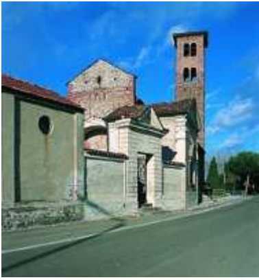
La Chiesa di San Pietro al Cimitero di Casalvolone