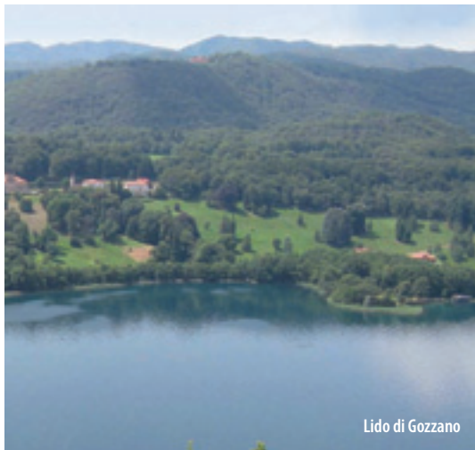
Lido di Gozzano

and 1516 - it was decided that the two communities of Orta and Gozzano had to be subject to the spiritual and temporal dominion of the bishops, which finished in 1805 with the Napoleonic occupation, when it was assigned to the Department of the Agogna. It then went to the Savoias on October 7, 1817.