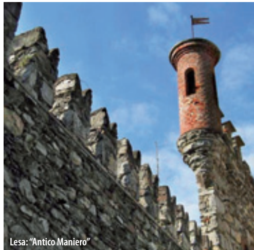
Lesa: "Antico Maniero"

Between XVII century was built the small oratory characterized by a unique hall within Baroque fresco paintings. The external facade has a portico supported by four columns and small steeple has a bellfry on top.