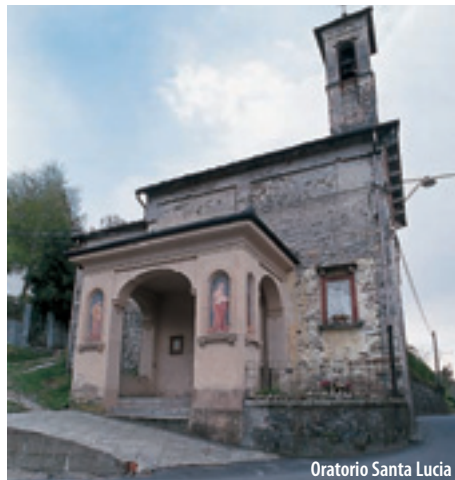
Oratorio Santa Lucia

Across the years an important resource for Armeno village were mountain pasture called "Alpi". Some of them are still present and useful in the area: Vaulunga, Lovaga, Corteno, Valpiana e Vermenasca. Families and animals spend the summer period from May to September up hills. The community lived and worked there with different rules: ladies in house works, kids looking after animals, men did hard works, old people helped in small activities.