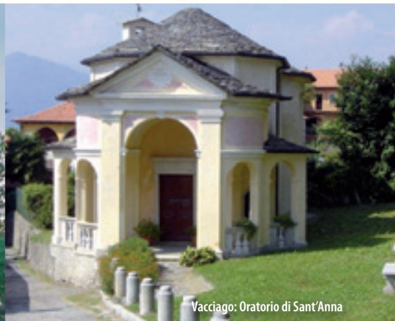
Vacciago: Oratorio di Sant'Anna

Mount Mesma is 576 m high and stands in a scenic position. Here is situated the Franciscan convent, whose construction dates from 1619. The complex has two Baroque cloisters leading to the gable-roofed church, whose interior contains interesting paintings. Two mule paths starting from the road just outside Bolzano and Lortalto lead to the convent.