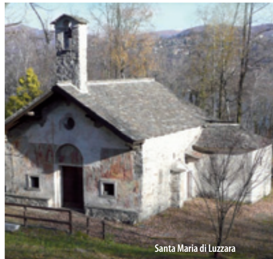
Santa Maria di Luzzara

The small church dedicated to the Nativity of the Virgin rises along the road that leads to San Maurizio d'Opaglio. The single-roomed building with three oriented apses dates back to the 11th century. The facade is V-shaped and a curious sail-shaped bell tower emerges on the roof. The frescoes on the inner and outer walls are beautiful.