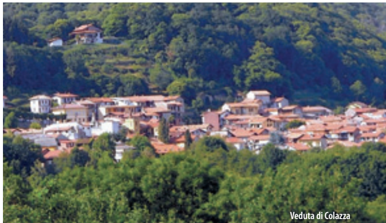
Veduta di Colazza

Colazza sorge a 517 metri sopra il livello del mare, alle radici del Motto dell'Arbujera. I monti Cassinario (712 m), Tesserà (759) e La Guardia (830), che chiudono la valletta del Tiasca, offrono al paese un grande contributo di acque, di buoni pascoli e di alpeggi. Il ritrovamento di due monete romane testimonia le antiche origini del paese. Si presume che esso prenda il nome da "colla", cioè valico, perché dallo stesso abitato passava la via che valicava i colli in direzione di Ameno e della Riviera d'Orta. Le attività produttive del territorio sono da sempre legate alle risorse forestali. Fino a pochi anni fa, ad esempio, era rinomata la produzione di "sciù par i macelà", ossia ceppi per macellai. Una caratteristica tipica del paese è l'elevato numero di