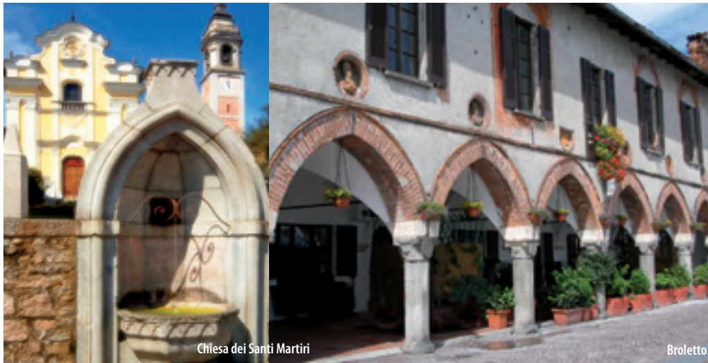
Chiesa dei Santi Martiri