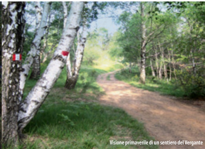
Visione primaverile di un sentiero del Vergante