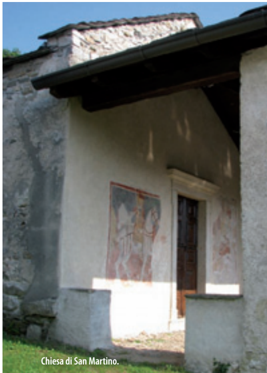
Chiesa di San Martino.