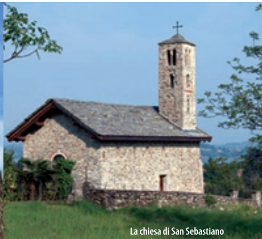
La chiesa di San Sebastiano