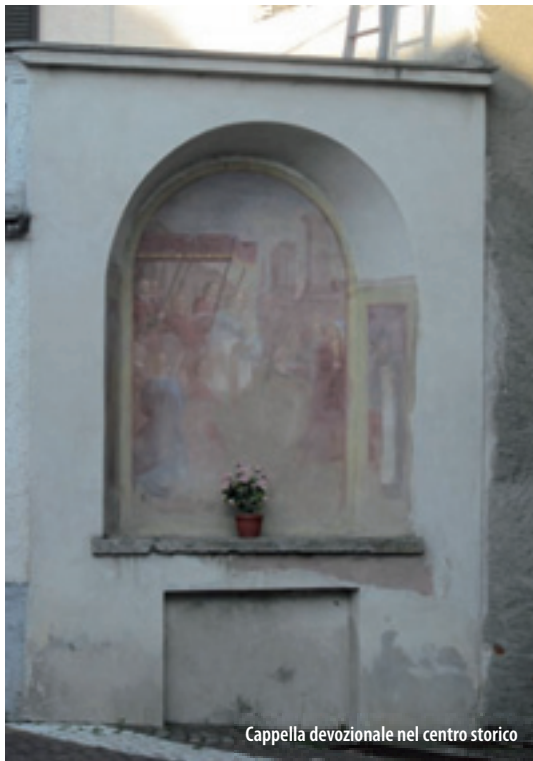
Cappella devozionale nel centro storico