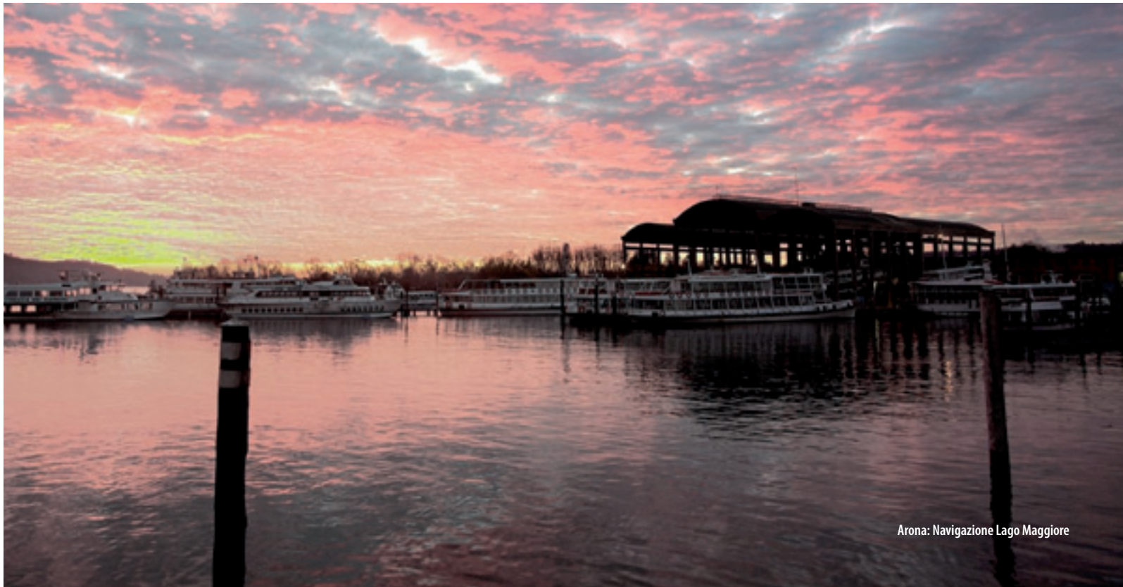
Arona: Navigazione Lago Maggiore