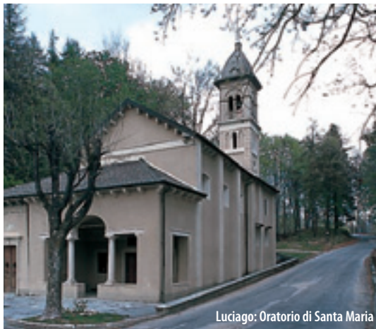
Luciago: Oratorio di Santa Maria

Near the cemetery, on the southern edge of town, stands the beautiful Romanesque church of Santa Maria Assunta, mentioned in a document of 1217 as belonging to the parish of San Giulio. According to tradition it was founded by the Greek saint, preacher of the Gospel in the Cusio area. The wonderful facade, essential in its style, is built with squared stone blocks and has a portal ornamented with capitals and columns, whose decorations recall the most traditional medieval symbolism. The three naves are Romanesque while the