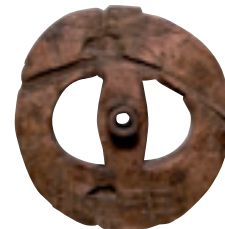
Ruota ritrovata ai Lagoni

area of Lagoni di Mercurago, to the Iron Age (Cultura di Golasecca) and finally to the Gallo-Roman and Roman ages. Very important and emblematic find is the mould of the Mercurago wheel. The mineralogical museum show to the visitor samples of stones of the Ossola Valley and Baveno following a teaching method that uses aesthetic samples, fossil specimens and visualmicroscopic location to observe the smallest crystals.