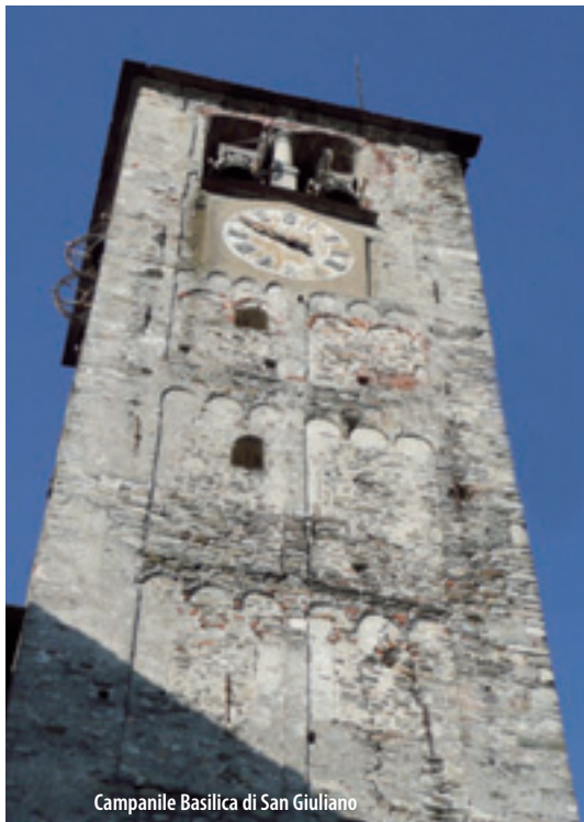
Campanile Basilica di San Giuliano