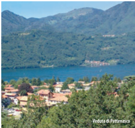
Veduta di Pettenasco

"The area of Pettenasco (Pitinasci, Pitenascum and Peltinascum), flat and located on the shore of the lake, is rich in drinkable supplies. Woodlands, full of chestnuts and pastures, stretch into the lands of Carcegna, Armeno, Pratalongo, Crabba and the lake". "This area is half-circular, with Earth in its middle; on its southern part lies the low outlet of the Pescone: flowing down from upper mountains, this river enters into the lake giving impulse to water mills and iron forges. Thanks to