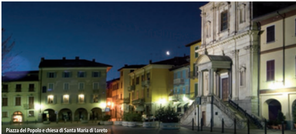
Piazza del Popolo e chiesa di Santa Maria di Loreto

Situated in the medieval nucleus of the town, near the Romanesque steeple (11th century), the Collegiate church was built in 1488. The "Polittico della Natività" by Gaudenzio Ferrari is an impressive piece of work. Worth noting are two late 15th century frescos by artists from Novara, situated on the far end chapel of the Cappella degli Innocenti. The six tapestries by Morazzone reproduce the different episodes of the life of the