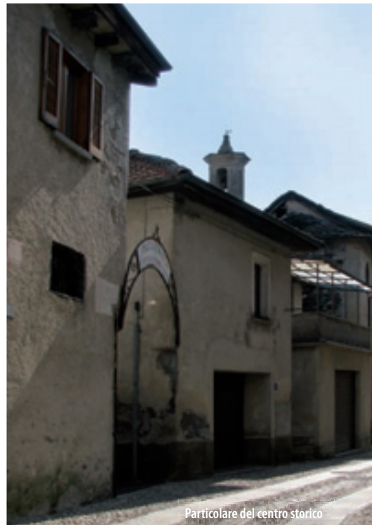
Particolare del centro storico

La produzione di oggetti di legno tornito è stata una caratteristica dell'artigianato cusiano fino agli anni Cinquanta e ancora oggi a Pettenasco alcune ditte propongono prodotti che derivano da tale tradizione. Il Museo dell'Arte e della Tornitura del Legno, ha trovato recentemente sede nell'antica torneria posta sulla Roggia Molinara. Dopo un accurato e originale intervento di restauro, offre al pubblico una pregevole mostra di attrezzi, utensili, macchinari e oggetti provenienti da vecchie "fabbriche" e laboratori artigianali locali. Il museo è parte dell'Ecomuseo del Lago d'Orta e Mottarone al quale ci si dovrà rivolgere per la visita.