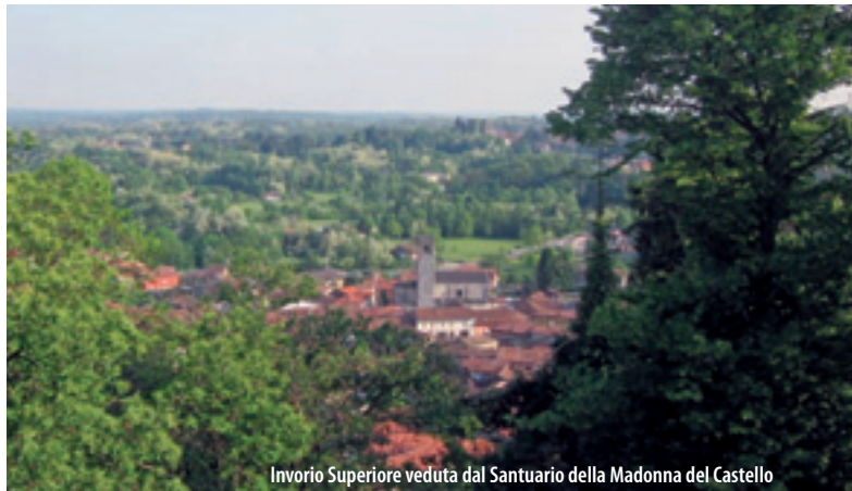
Inverio Superiore veduta dal Santuario della Madonna del Castello