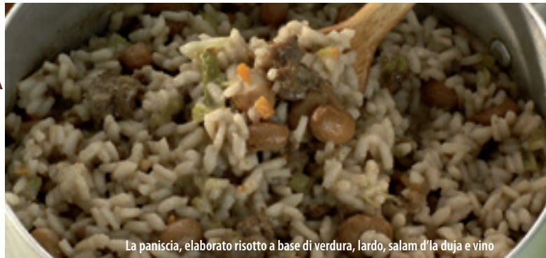
La paniscia, elaborato risotto a base di verdura, lardo, salam d'la duja e vino

stagionato nel grasso di maiale in recipienti di terracotta, le duje, e infine il salam d'oca, carne d'oca lavorata con pancetta di maiale e vino bianco, insaccata nella pelle del collo dell'oca. Vari e gustosi sono anche i piatti tipici serviti nei ristoranti della zona, a base di funghi, lumache, anatra, pesci e molluschi di lago e fiume. Caratteristico di quest'area, ad esempio, è il Tapulòn, stracotto di carne d'asino (o di cavallo) tritata e ben speziata con aglio, alloro, chiodi di garofano e rosmarino, ammorbidita con verza rosolata e cotta lentamente con l'aggiunta di vino rosso locale. Non va dimenticata la paniscia, piatto tipico a base di riso, con verze, fagioli, cotiche di maiale, lardo, salam d'la duja e vino rosso. Si può consumare anche al salto, cioè abbrustolita da una breve ricottura in una padella di ferro. L'itinerario della buona cucina è, quindi, uno spunto fornito al turista che desidera integrare gli itinerari culturali e naturalistici con un "gustoso" percorso enogastronomico. Numerosi ristoranti propongono menù tipici della zona, altri offrono la possibilità di degustare cibi e vini locali.