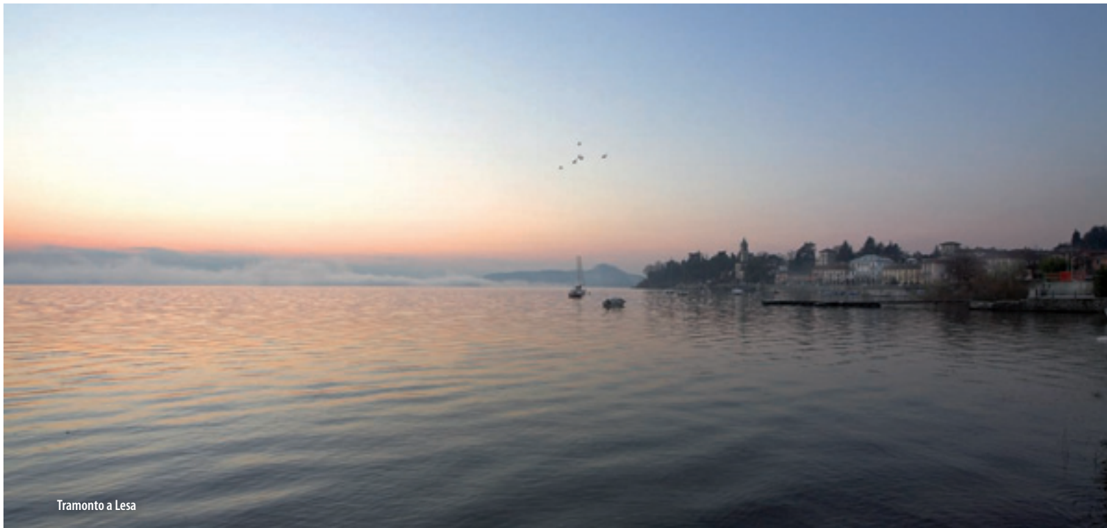
Tramonto a Lesa