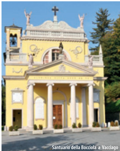
Santuario della Bocciola a Vacciago

In a scenic position on the road from Vacciago to Ameno, the Sanctuary stands on the remains of a small church which was