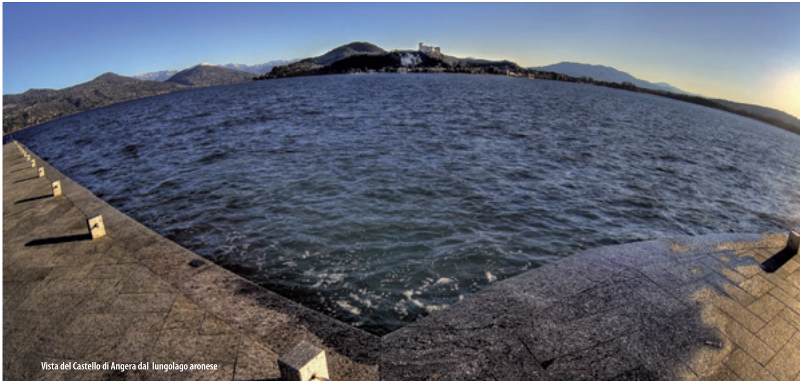
Vista del Castello di Angera dal lungolago aronese