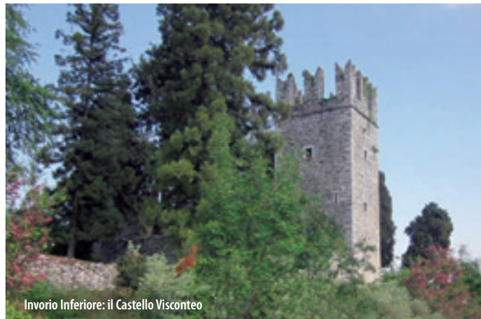
Inverio Inferiore: il Castello Visconteo

Come testimoniato da un documento del 1039, il castello di Inverio esisteva già attorno al Mille. Possesso dapprima dei conti di Pombia, poi dei conti di Biandrate, pervenne infine, nel corso del XIII secolo, ai Visconti (dei quali Inverio contende a Massino Visconti i natali). Distrutto da Galeazzo Visconti tra il 1356 e il 1358 per impedire che cadesse nelle mani nemiche dei marchesi del Monferrato, non venne in seguito più ricostruito. Rimane tuttavia ben conservata e degna di nota, una torre, alta 17 m e contornata alla sommità da una merlatura a coda di rondine.