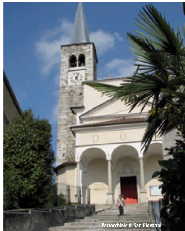
Parrocchiale di San Giovanni

This church, begun in 1545 and consecrated by bishop Bascapè in 1559, has two naves and is dedicated to St John. It is worth a visit for its magnificent wood carvings (from the 17th and 18th centuries) in the choir and the pulpit, and the gilded frame of the altarpiece and the reliquary. There is a handsome pipe organ built in 1705 by Gavinelli, with an impressive choir in delicate walnut intarsia. Noteworthy are the frescoes: the oldest is from 1614 in the Baptistry, showing four scenes of the life of St John the Baptist; the later ones (1896) attributed to Francesco Colombo, adorn the vault of the central nave and depict St Joseph, the Virgin and St John the Baptist.