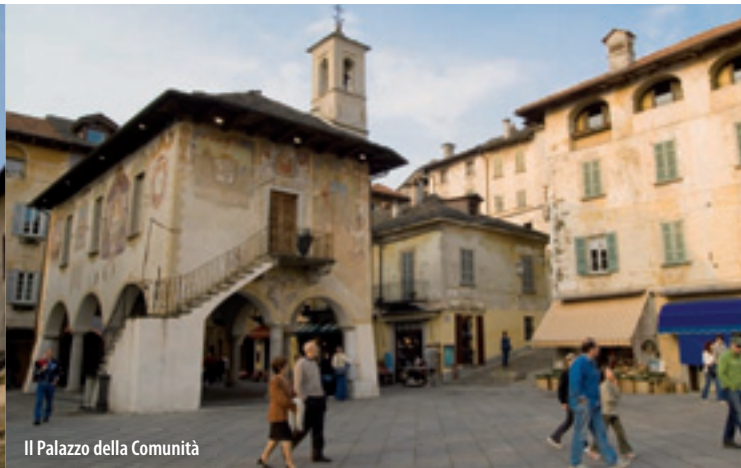
Il Palazzo della Comunità

by Rossetti, Cantalupi, and Orgiazzi. In the Gemelli chapel hangs a noteworthy canvas by Procaccini, depicting St Charles Borromeo at the Procession for the Plague of Milan.