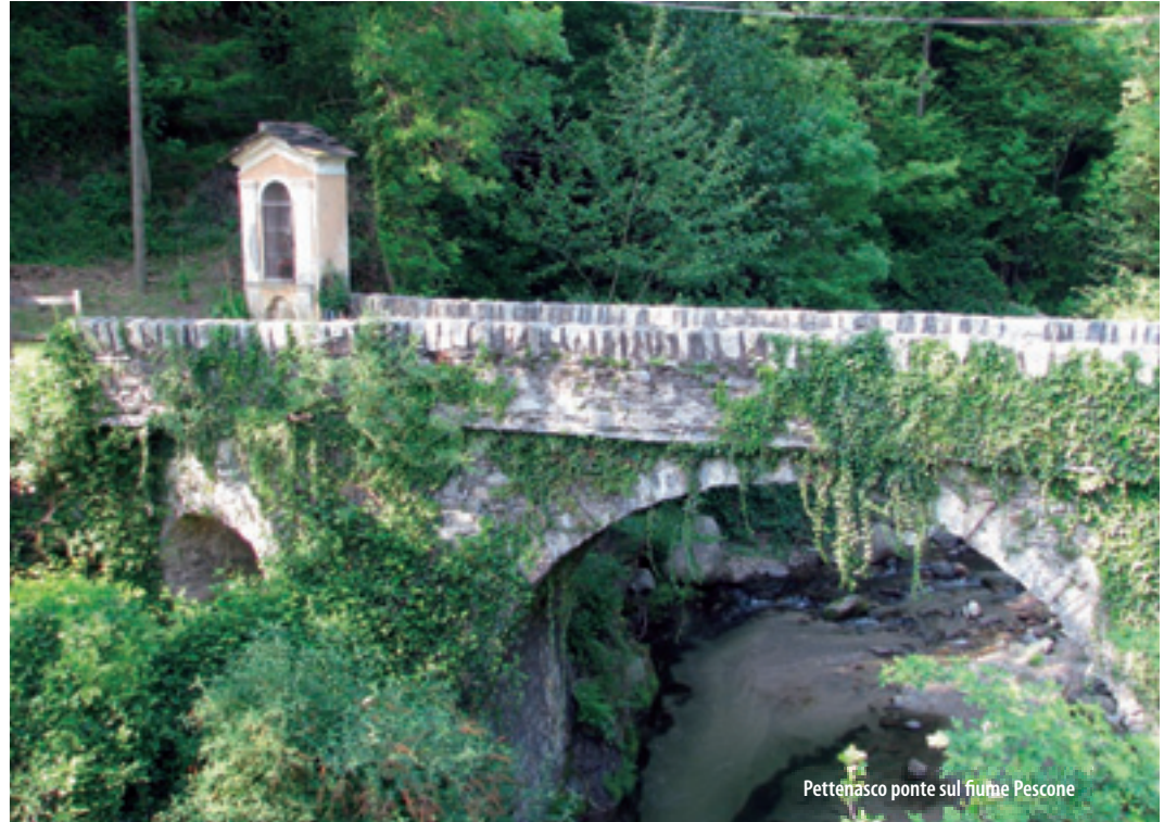
Pettenasco ponte sul fiume Pescone

Located on the piazza del Municipio, this house it is today the headquarter of the local Association "Pettenasco Nostra", organizing many tourist and cultural events, and the headquarter of the IAT (Tourist Office). Some of the rooms house temporary exhibitions. The courtyard of the house is occasionally used as a "concert hall".