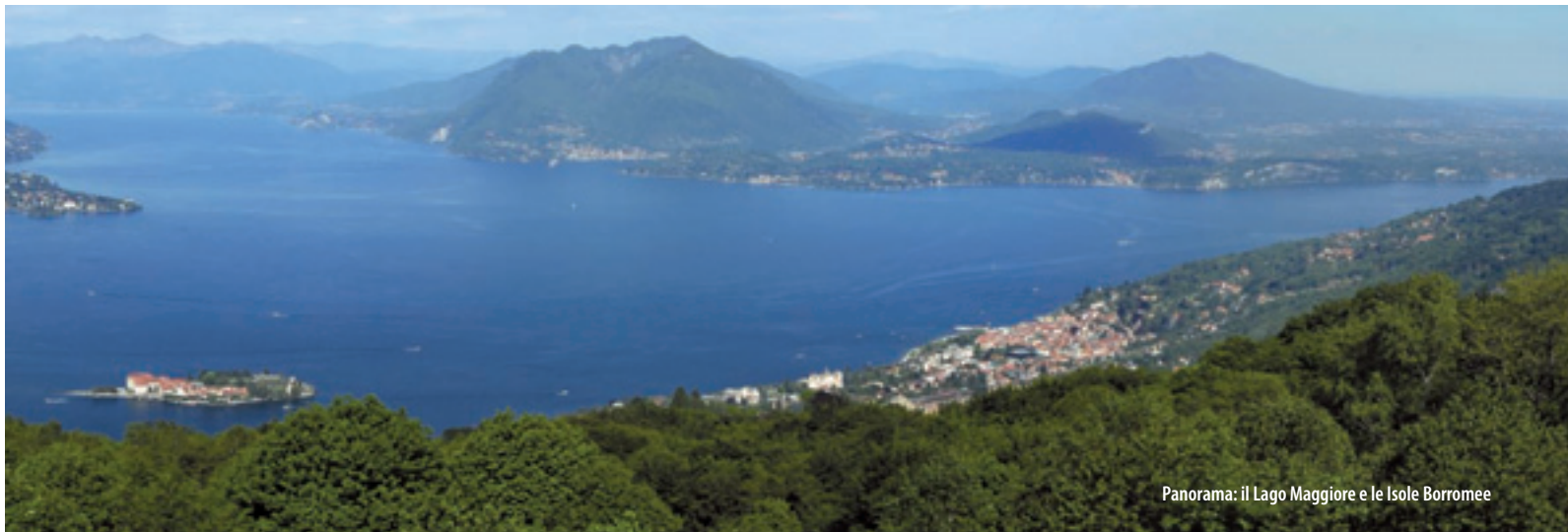
Panorama: il Lago Maggiore e le Isole Borromeo

From a geographical perspective the “territory of the two lakes” consists of a low-mountain region, which includes the peaks of mounts Zucchero (1230 m), Mottarone (1491 m) and Falò (1080 m), extensively covered by forests and with a high density of bodies of water (Lake Maggiore and d’Orta, and the Agogna, Emo, Tiasca, Vevera streams). These streams, Agogna and Terdoppio, run on roughly parallel courses from the area around Novara to the river Po. The name “valli sospese” (suspended valleys) derives from this particular