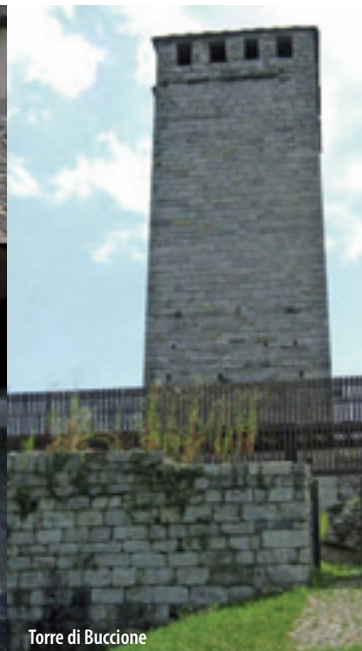
Torre di Buccione

Instituted to protect and preserve the Buccione Tower, the park extends for about 51 hectares on the eastern bank of Orta Lake, between Gozzano and Corconio, on the wooded hill (chestnuts and oaks) crowned by the majestic Buccione Tower, of special historical interest.