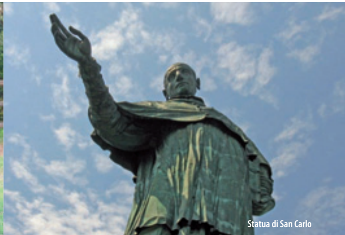
Statua di San Carlo

mineralogico espone campioni del distretto ossolano e bavenese secondo un percorso didattico integrato da campioni estetici, da esemplari di fossili e da una postazione video - microscopica per l'osservazione dei cristalli più minuti.