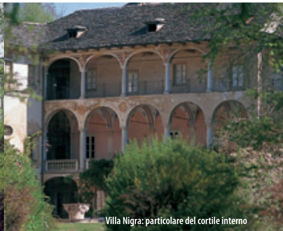
Villa Nigra: particolare del cortile interno