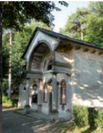
Particolari del Sacro Monte