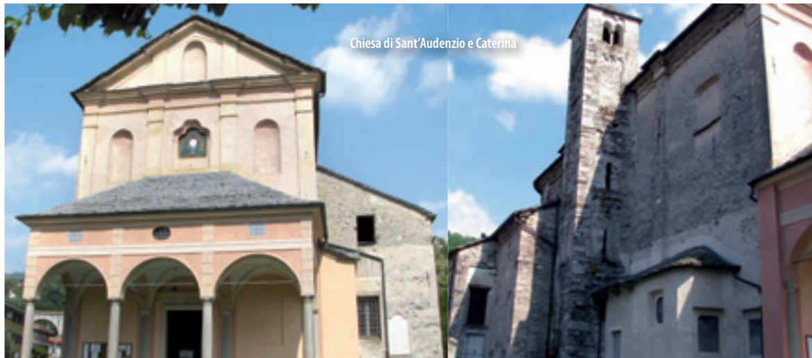
Chiesa di Sant'Audenzio e Caterina

The manufacture of wooden objects is another traditional activity of the Riviera del Cusio. The Museum of Wood Art and Handicraft has recently opened in an ancient wood-turning workshop along the Roggia Molinara, accurately and beautifully restored. The museum displays a rich collection of tools, utensils, machinery and other objects from old "fabbriche" (factories) and from local workshops. This museum is a department of the Ecomuseo del Lago d'Orta e Mottarone (they organize visits on request).