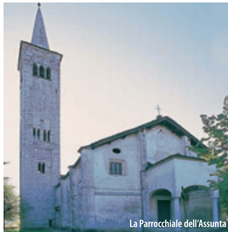
La Parrocchiale dell'Assunta

In bella posizione panoramica sorge il Monte Mesma. È qui collocato l'omonimo convento francescano, la cui costruzione risale al 1619. La struttura presenta due chiostri barocchi dai quali si accede alla chiesa a capanna, che accoglie al suo interno alcuni interessanti dipinti. Partono dalla strada, appena fuori dagli abitati di Bolzano e di Lortalto, due mulattiere in salita con