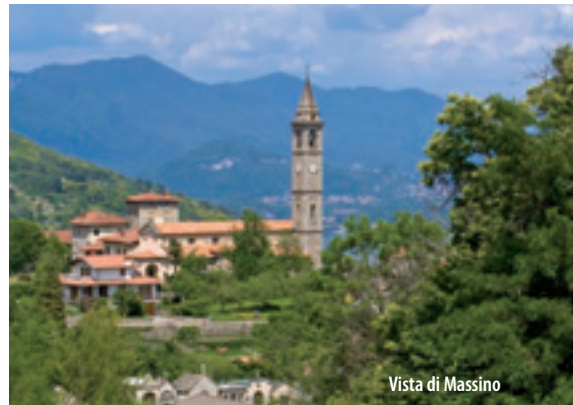
Vista di Massino

Massino Visconti, at 465 m above the sea level, lies on the median slope of the Mount San Salvatore (749 m). It's name Massino, probably of roman origin, comes from the word "mass"