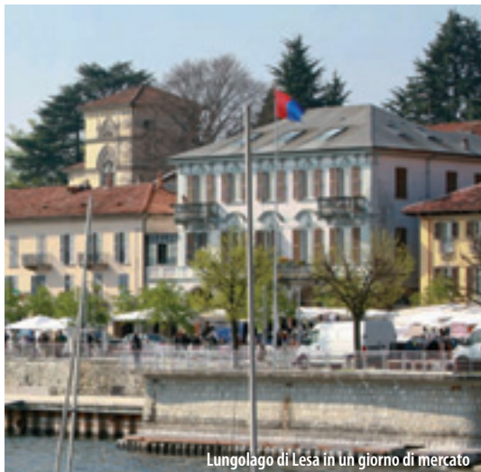
Lungolago di Lesa in un giorno di mercato

Lesà lies on the western shore of Lake Maggiore at 198 m above the sea, at the foot of Motta Rossa, on the shelf formed, by the river Erno, during millennia. The archaeological finds of the 19th century and the Celtic and Roman toponyms witness the old origins of the town. In the area of Calogna and Comnago and in the other settlements of Motta Rossa, many are the rocks with "cuppelle" (minor