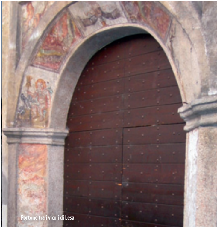
Portone tra i vicoli di Lesa