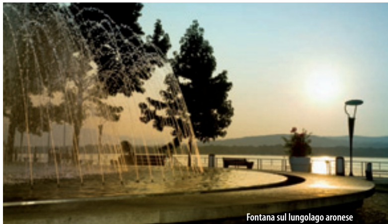
Fontana sul lungolago aronese

Situated between the southwestern shore of Lake Maggiore and the Vergante hills, in front of Rocca di Angera, Arona is an important tourist destination and climatic resort. Several