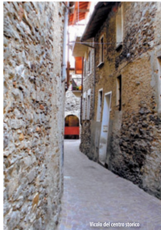
Vicolo del centro storico

La chiesa parrocchiale dedicata all'Immacolata sorge in posizione panoramica: dal sagrato si può godere una della viste più ampie di tutto il Vergante sul lago e sulla pianura. Edificata nel XVII secolo e ampiamente rimaneggiata nel XIX secolo, la chiesa conserva nel coro un bell'affresco raffigurante la Beata Vergine Maria, San Grato e il Bambino,