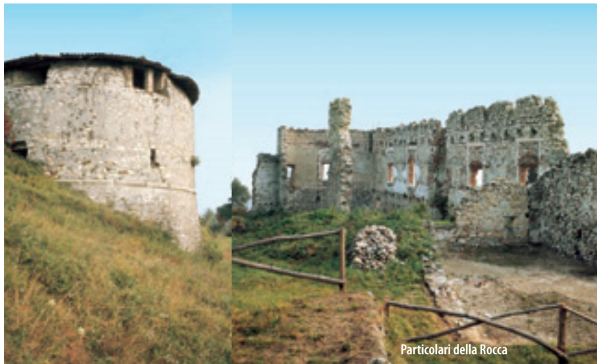
Particolari della Rocca

Arona è sorta ai piedi del baluardo naturale della Rocca, che insieme alla gemella Rocca d'Angera controllava militarmente il basso Verbano. Fu abitata fin dall'antichità: infatti vi si sono trovati reperti neolitici e della Tarda Età del Bronzo. Almeno dal X secolo fu fortificata e sempre più potenziata nei secoli successivi fino all'inizio dell'Ottocento, quando Napoleone decise la distruzione totale della Rocca, perché poteva offrire al nemico un vantaggio per ostacolare il ritorno in Francia delle sue truppe. A partire dal 1970 fu trasformata in parco pubblico, aperto a tutti coloro che vi salgono, non soltanto per visitare i ruderi del castello, ma anche per godere la splendida vista che il luogo panoramico offre sul lago e sulla sottostante Arona. Oggi è in attesa di ristrutturazioni e del rilancio turistico.