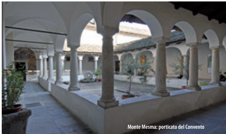
Monte Mesma: porticato del Convento

punto di vista geologico, il territorio di Ameno è contrassegnato nella zona meridionale da scisti e porfidi. Prima del secolo XI il paese subì la dominazione dei Goti, dei Longobardi e dei Franchi; quindi, nel periodo feudale, fu di proprietà dei Vescovi di Novara, dei Visconti e degli Sforza. Una meta di grande interesse è il Monte Mesma dalla ricchissima vegetazione, sulla cui cima sorge un complesso monumentale costituito da un convento, una chiesa francescana e venti cappelle ubicate lungo un percorso processionale.