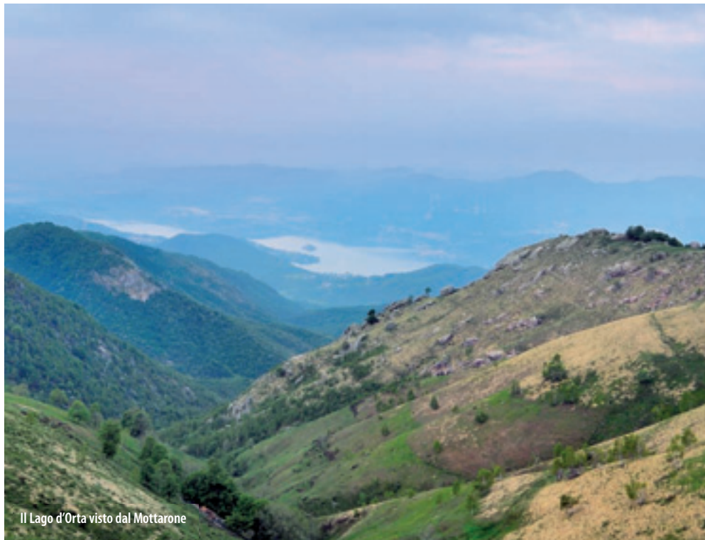
Il Lago d'Orta visto dal Mottarone

The Ecomuseum of the Lake Orta and of the Mottarone was created in 1997. It aims to offer a "varied cultural survey" of the territory around the Lake Orta and of the "Land between two lakes" (Terra tra i due laghi), an area of strong tourist interest. The Ecomuseo is the first experiment of the kind in Piedmont and few are the similar experiences on the entire national territory. Presently, the Ecomuseo is formed by several collections related to the history and the material culture of the area. The Ecomuseo is also creating a computerized catalogue of the patrimony of the area.