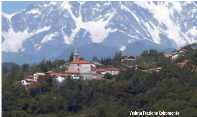
Veduta Frazione Coiomonte

“I lavatoi di Armeno sono tutti di granito; solo quello del Mulinaccio è di cemento. Le tettoie sono di tegole, eccetto quella del Borghetto che è di cemento”. “Ad Armeno c’è solo una cava di terra e appartiene al Comune. Si trova ad est del paese lungo la strada di Coiro, è larga 15 metri e alta 10 metri. Sulle montagne di Coiro si trovano minerali che contengono piombo, ferro e qualche piccola striscia d’oro. Verso il Mottarone abbonda il granito”. “Il clima è da zona prealpina, rigido in inverno e piuttosto freddo anche d’estate. Le frazioni di Armeno sono Coiomonte con 210 abitanti, Sovazza con 320 abitanti, e poi le borgate di Bassola e di Cheggino”. “La strada più antica è la Novarese, la strada che da Bolzano va a Miasino