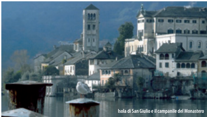
Isola di San Giulio e il campanile del Monastero