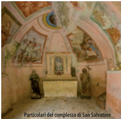
Particolari del complesso di San Salvatore