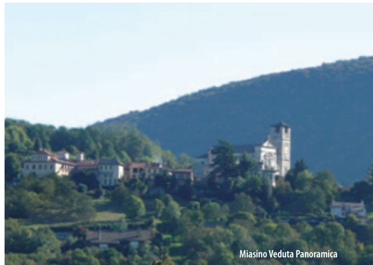
Miasino Veduta Panoramica

Il comune di Miasino, con i suoi suggestivi punti panoramici, è situato sul lago d'Orta, in un verde falsopiano fra la Motta di Carcegna e i monti Formica e La Guardia. I primi insediamenti abitativi risalgono almeno all'Età del Ferro. Di quest'epoca è un cinerario ritrovato nella frazione di Carcegna. Scavi successivi hanno portato alla luce epigrafi etrusche e una necropoli di età galloromana e romana risalente al I secolo a.C. e utilizzata fino al III secolo d.C. Nella località Castello, presso Carcegna, sono ancora visibili i resti di una fortificazione presumibilmente medievale. Nel paese si trovano pregevoli esempi di architettura: tra le costruzioni più belle merita di essere citata Villa Nigra, esempio di residenza aristocratica, mentre tra gli edifici a carattere religioso spicca per maestosità la Parrocchiale di San Rocco.