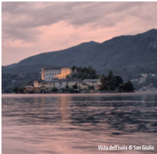
Vista dell'isola di San Giulio

Facing the Isle of San Giulio, on the western part of the Sacro Monte (in 2003 it was inscribed in the "World Heritage List" and is protected by UNESCO), lies Orta with its splendid setting, its old houses and Baroque palaces, its beautiful, narrow and winding streets: all this makes it one of the most picturesque and better preserved places in the whole area. The first inhabitants of Orta were thought to have lived in the