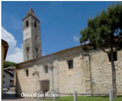
Chiesa di San Michele