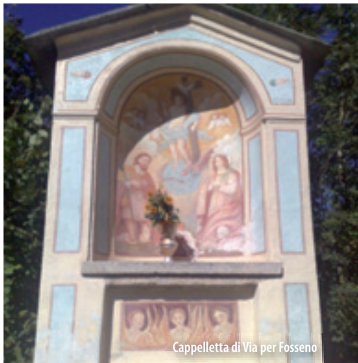
Cappelletta di Via per Fosseno