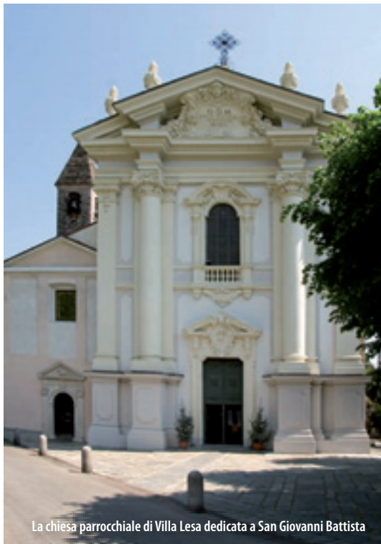
La chiesa parrocchiale di Villa Lesa dedicata a San Giovanni Battista