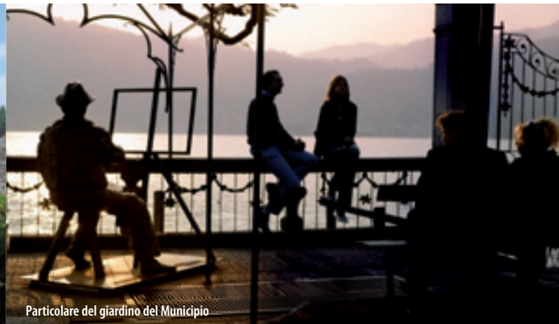
Particolare del giardino del Municipio

Up hill Salita della Motta we find The Parrocchiale di Santa Maria Assunta and walking trough via Gemelli we reach the old Cemetery and via San Quirico. Walking down from Parrocchiale the old market place and at the end of via Bersani the Oratory of San Bernardino. Going back we arrive in the heart of Orta: the fabulous Piazza Motta directly on the lake side. Some other carved stones and symbols are visible in via Olina, Stretta del Bolzano Contrada dei Monti and San Rocco Oratory.