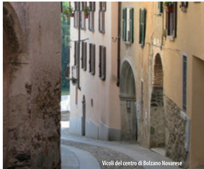
Vicoli del centro di Bolzano Novarese

Bolzano Novarese ha origini almeno romane per alcuni ritrovamenti funerari dell'epoca. Inoltre il nome del fiume Agogna, che attraversa il territorio per circa due chilometri, si fa risalire alla popolazione gallica degli Agoni. Dopo la caduta dell'Impero Romano d'Occidente, avvenuta nel 476 d.C., le notizie del territorio restano avvolte nell'oscurità. La sua posizione geografica è particolarmente felice. Situato a 420 metri sul livello del mare, gode della vista di colline e montagne ad ovest e a nord: la sponda occidentale del lago d'Orta, il Monte Avigno, la torre di Buccione, il Monte Mesma, il Monte Barro, sino a intravedere i più distanti ed elevati Monte Massone, il Mottarone e la sagoma del Monte Rosa. La vegetazione, ricca di alberi spontanei (tra cui roveri e castagni), ma anche di alberi introdotti dall'uomo (faggi, abeti, frassini e querce americane), è estremamente rigogliosa grazie