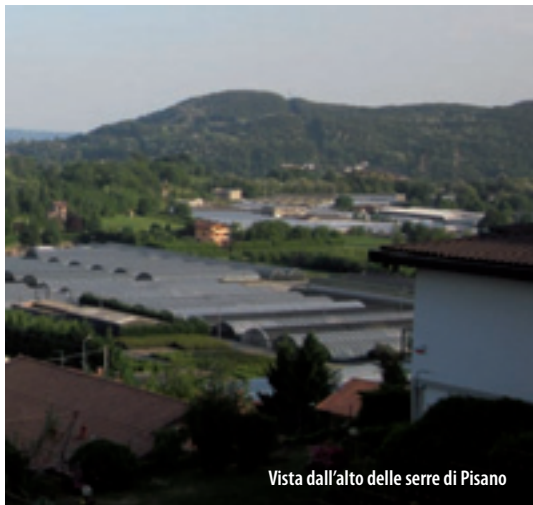
Vista dall'alto delle serre di Pisano

Two small necropolises discovered at the end of the town date from this period. Furthermore an engraved rock, Sass Priatécia or Sasso del Diavolo, in the woods above the town evidence ancient pre-Roman veneration cults. In the heart of Pisano are remarkable rests of medieval portals. From this period date also the main street and the small lanes, along which many votive little chapels and works of local painters and craftsmen can be