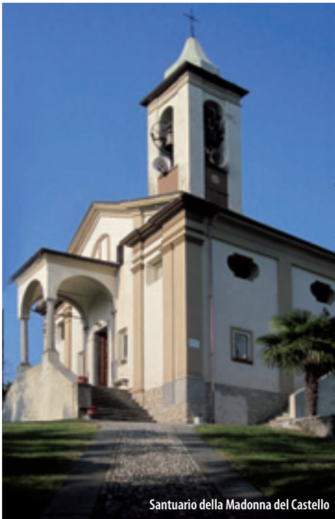
Santuario della Madonna del Castello