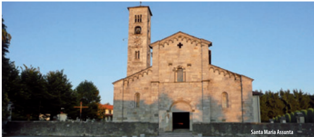
Santa Maria Assunta

"There are only granite wash-houses in Armeno but one, that of Mulinaccio, made of cement. Every roofing is made of tiles, apart from the one of the Borghetto, made of cement". "Owned by the Municipality, the only earth quarry in Armeno is in the eastern part of the town, on the way to Coiro; it is 15 meters wide and roughly 10 meters high. In the mountains of Coiro minerals containing lead, iron and some little golden strips can be found. Near the Mottarone there is a lot of granite". "Harsh in Winter and rather cool even in Summer, this is the typical climate of foothill Alps. The hamlets of Armeno are Coiromonte with 210 inhabitants, Sovazza with 320 inhabitants and the villages of Bassola and Cheggino". "The oldest street is the Novarese, the street that from Bolzano goes to Miasino and Armeno and onwards to Omegna. The Road of the Two Riviere, the one towards Coiromonte and the one northbound leading to the Mottarone follow. Then there are the mule paths passing through the manifold pastures, and the bridges of Bassola, of Pescone della Vallaccia, and the small one near the trattoria Campagnola on the route Omegna-Armeno." (These descriptions are taken from the school notebook written by a child of Armeno - 1958, in O. Rinaldi, Armeno: il suo Novecento, Comunità Montana dei Due Laghi, 1997).