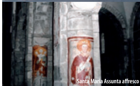
Santa Maria Assunta affresco