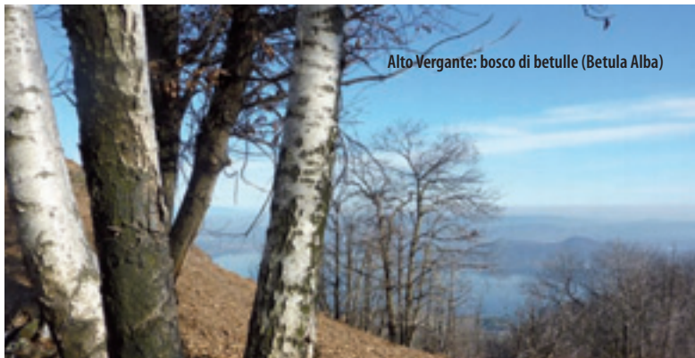
Alto Vergante: bosco di betulle (Betula Alba)

La superficie forestale fornisce nutrimento e protezione per una consistente popolazione faunistica. Notevole è la presenza di uccelli stanziali: fagiano, starna e colino della Virginia e migratori: germano reale, gallinella d'acqua, folaga, pavoncella, quaglia, tortora e allodola. I rapaci diurni sono rappresentati da: poiana, falco pescatore, falco pellegrino, gheppio e sparviere. La gazza e la cornacchia grigia sono, invece, le presenze più significative tra i corvidi. Per quanto riguarda i mammiferi, i boschi, le radure, le aree verdi lungo fiumi e ruscelli costituiscono l'habitat ideale per lepore, silvilago (o minilepre), coniglio selvatico, volpe, tasso, nutria, cinghiale, capriolo, cervo e daino.