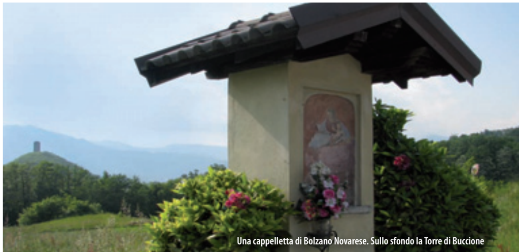
Una cappelletta di Bolzano Novarese. Sullo sfondo la Torre di Buccione