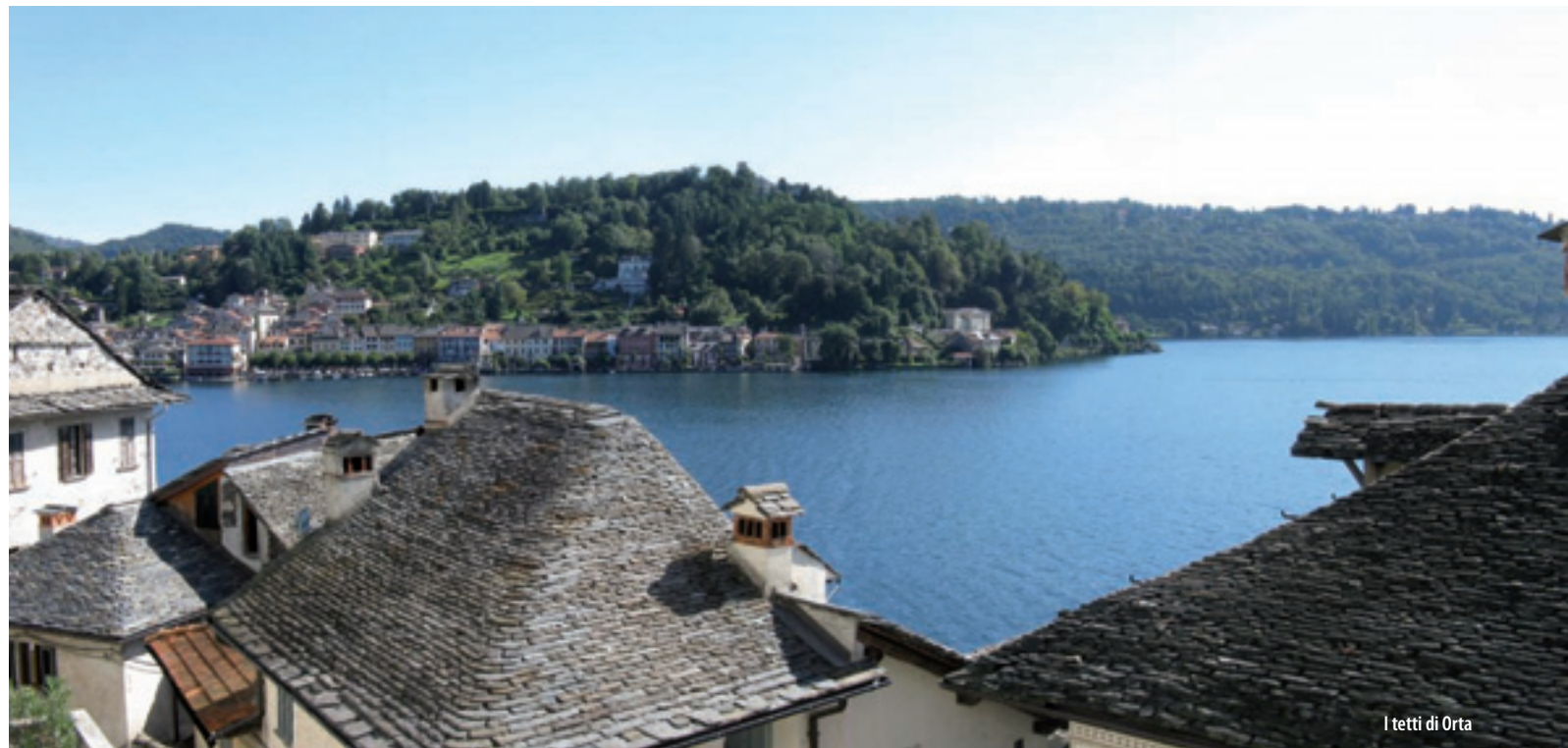
I tetti di Orta