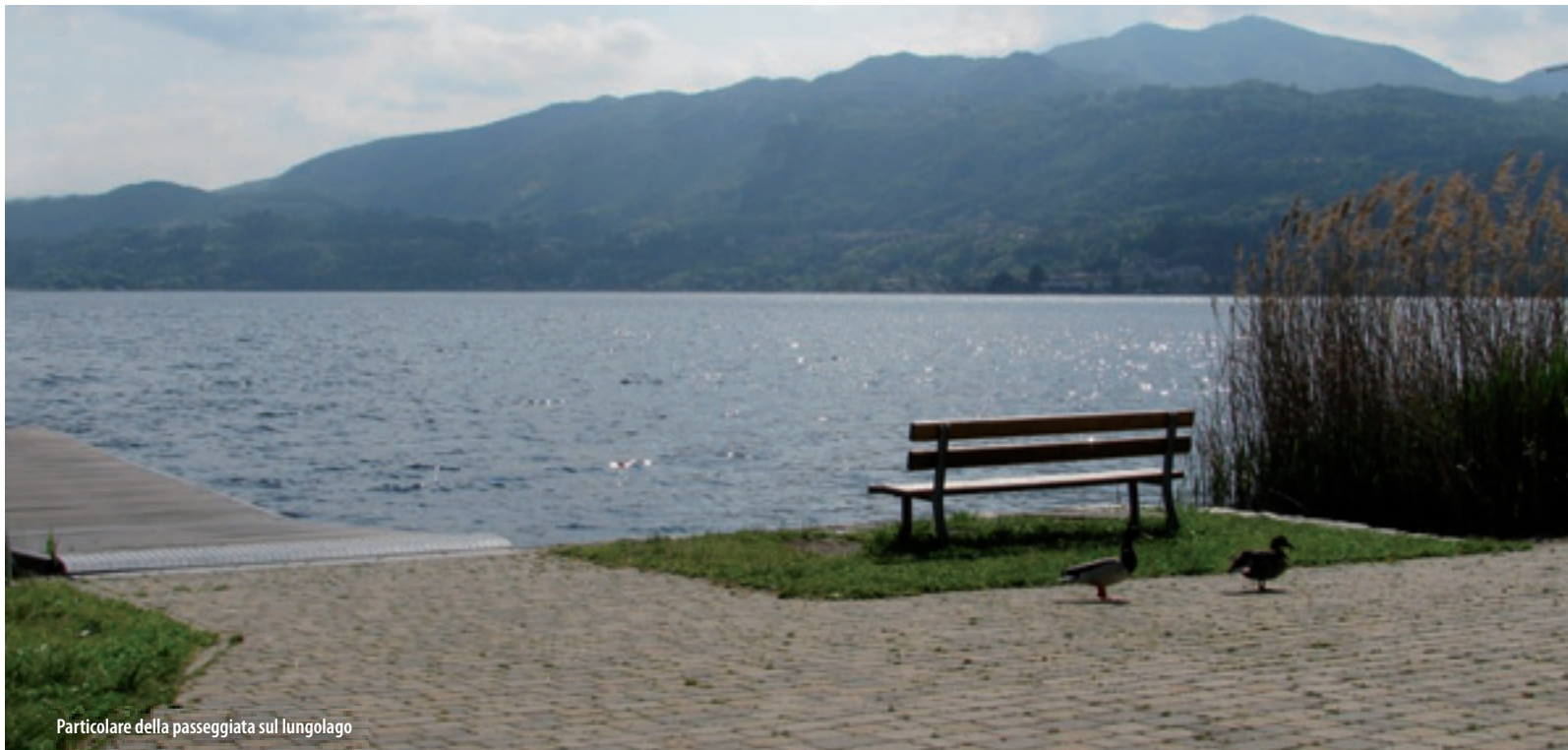
Particolare della passeggiata sul lungolago