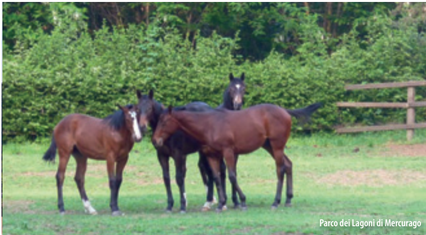
Parco dei Laghi di Mercurago